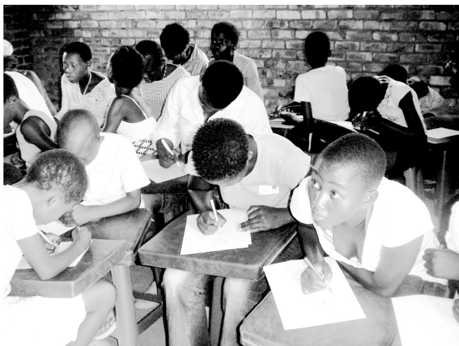
▲畫出心目中的濟公活佛法相。

願望，班員們的繪畫天份佳，其中有不少佳作，並帶唱相當好聽的「PROUD OF YOU」（英文原曲：揮著翅膀的女孩），期望班員們都以自己有雙無形的翅膀，可以發揮才能，為道場與人生付出而感到驕傲。