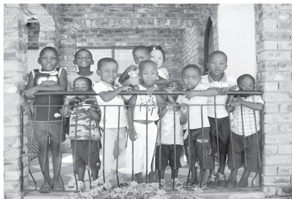
▲黑人小朋友來參加兒童班課程。

相當差距，而有黑人區、高級區之分。白人區街道安靜，房屋櫛比鱗次，行道樹林立，感覺十分舒適。