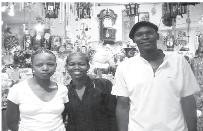
▲左起美麗、梅花、1SAC是當地資深幹部。

在進步、先進的國度，富貴與貧窮的拉距，彷彿天堂、地獄之別，不斷的進步中，這座塵土飛揚的城市，預告2010年世界盃足球賽將在此地舉行。早期的白人政策——種族隔離，導致黑人地位低落，白人當政、壓迫，更造成教育及生活水平